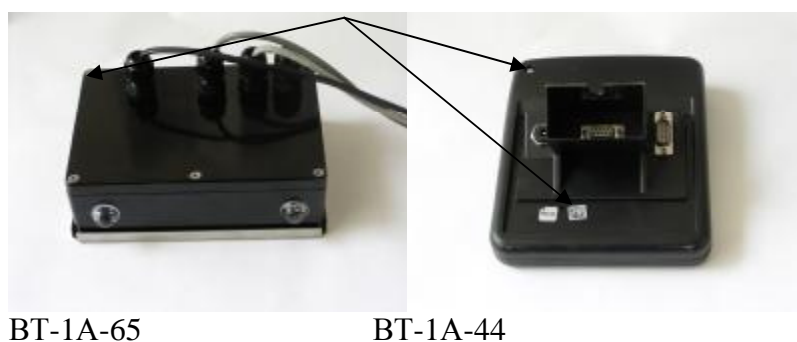
Рисунок 6 - Места пломбировки от несанкционированного доступа весов в исполнении П с индикаторами BT-1A-65 и BT-1A-44